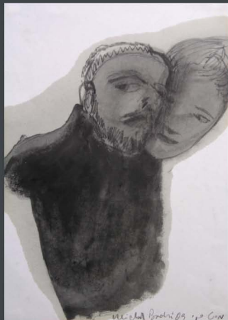
Michal Bachi Under the Lamplight and Pits series